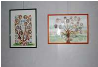
Arbres peints à la main