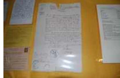
Extraits et actes