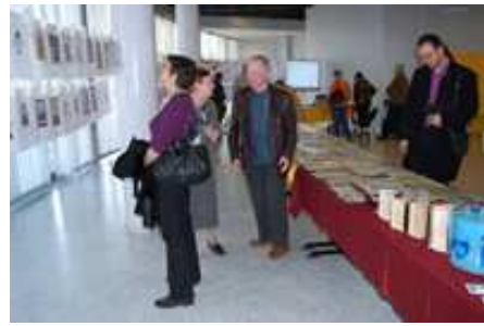
Merci à tous les visiteurs