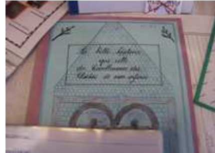
Les cloches Meilhan