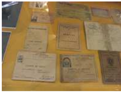
Documents de guerre 39-45