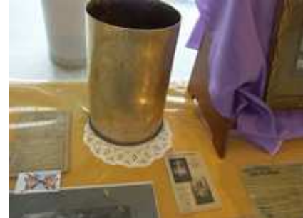
Obus gravé de 1915