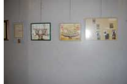
Arbres et tableaux généalogiques